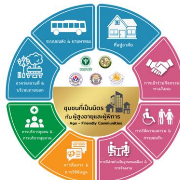
Logo เมื่อผ่านครบ 8 องค์ประกอบ