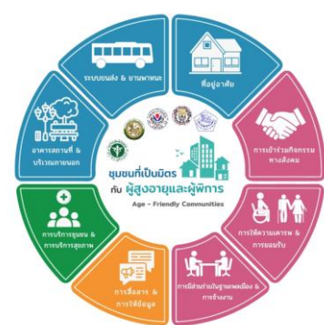
Logo ผ่าน 1 - 7 องค์ประกอบ